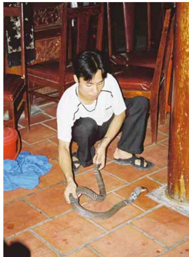
Večere / Dinner V mnoha případech je vám slavnostní chod nejprve osobně představen... The main course is usually personally introduced to you.