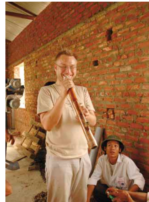
Šťastný expert / Happy Expert Práce na projektech přináší mnoho nových zkušeností. The project work brings a lot of new experience.