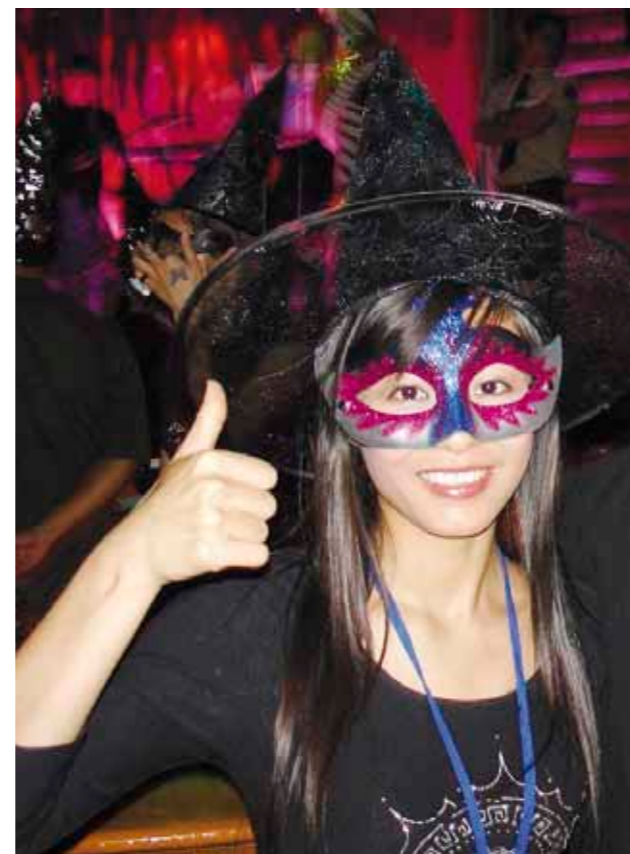
Halloween Jakýkoliv svátek je potřeba pořádně prožít. Every feast must be celebrated properly.