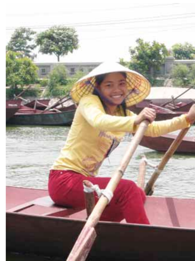
Průvodkyně / Guide Angličtina a svaly, aneb jak průvodcovat na řece. English and muscles – requirements for a river guide.