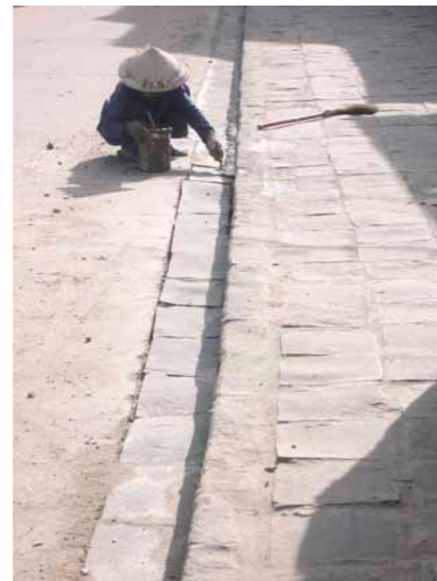
Stíny / Shadows Údržba a úklid ulic je doménou žen, vždyť je to snadná práce, že... Maintenance and cleaning of the streets is usually a domain of women. Isn't it an easy job?