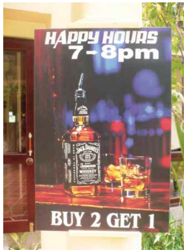
Dobrý obchod / Business Lépe vystihnout taktiku Vietnamců při obchodování nelze! You cannot describe the Vietnamese business tactic better!